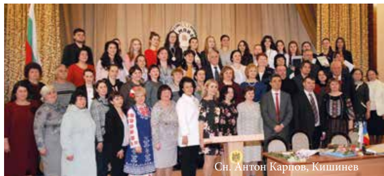
Сн. Антон Карпов, Кишинев

Награждаването бе на 14 април 2019 г. и бе почетено от Кети Генчева от Министерството на образованието на Р България, Денислава Ангелова, изпълнителен директор на Асоциацията „Докосни дъгата“, Ангел Маринков – консул в Посолството на Република България в Молдова и др. Закриването на олимпиадата беше много емоционално и тържествено – спектакъл от песни на български език, рецитация на българска поезия и разнообразни